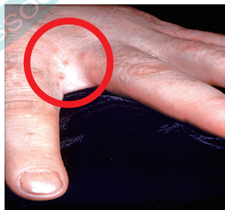
圖 1 在手指間的疥瘡小紅疹

疥瘡好發的部位於手指之間的指縫、手掌、手腕，肘部和膝蓋周圍折疊、腋窩、乳頭周圍（特別是女性）、腰部、陰莖和陰囊（男性）、下臀部和大腿上方、雙腳和腳底。除了幼兒外，少見於顏面、頭皮等處（如圖 2 藍色圈圈）。