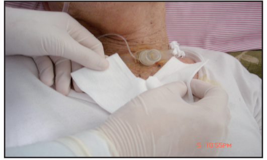
圖 2 Y 紗覆蓋方式

(十) 檢查頸繫帶是否過緊或過鬆，以能放入 1-2 指寬為原則，若繫帶髒濕，則予更換，並固定於頸部側邊。